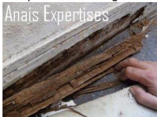
Pourriture cubique liée à la présence d'un mèreule