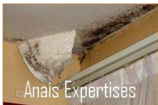
Moisissures liées à la présence d'une condensation excessive d'humidité

Il est difficile de lister de façon exhaustive toutes les sources d'humidité. Chaque bâtiment, chaque mode constructif, chaque terrain est différent. D'où l'importance de faire appel à un expert ANAIS.