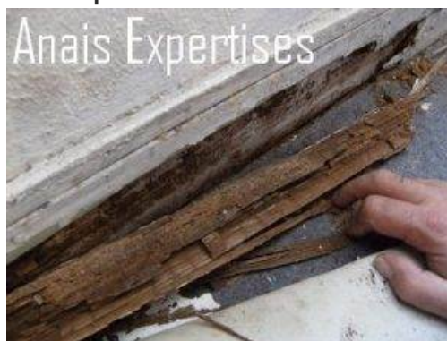
Pourriture cubique liée à la présence d'un mэрule