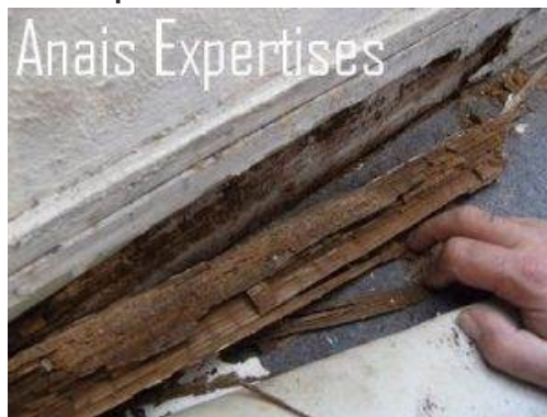
Pourriture cubique liée à la présence d'un mэрule