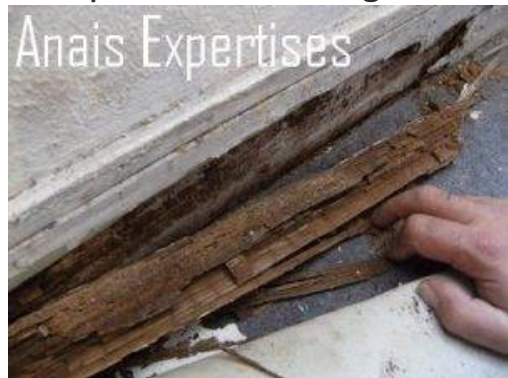
Pourriture cubique liée à la présence d'un mэрule